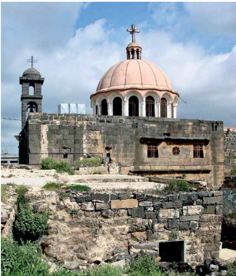
Церковь Пророка Илии в Эзре. 542 г.

значительного культурного центра и очага неоплатонизма, — остатки нескольких церквей, возведенных в IV–VI веках. В 1934 году в руинах одной из них, расположенной около главной улицы с колоннадой, бельгийские археологи обнаружили два реликвария, в которых когда-то хранились мощи святых Космы и Дамиана. Интересующий нас так называемый Восточный собор был больше храма Святой Феклы почти в полтора раза (его размеры 65 × 46 м). Он отличается большей массивностью четырех пилонов, на которые мог опираться каменный купол диаметром около 12 м, и наличием каменной экседры с престолом и синтроном вместо восточной колонны конхи подкупольного пространства. В соборе хранилась часть Креста Господня, что могло быть причиной особого выделения центральной части. Возведенный в конце V века, храм был сильно перестроен в 533 году после землетрясений 526 и 528 годов, разграблен персами в 540 году и арабами в 636 году. В 2012 году бывший город был захвачен боевиками, разрушившими часть построек, ра-