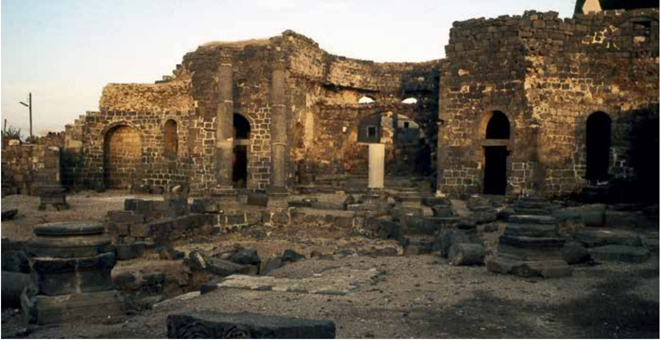
Собор Св. Сергия, Вакха и Леонтия в Босре. Строительство завершено в 512–513 гг.

енный вокруг «столпа», на котором подвижник жил и молился около 40 лет. Как писал в V веке епископ Феодорит Кирский, этот столп (башня) достигал высоты 16 м, но теперь осталось лишь его квадратное основание и фрагмент башни. Вероятно, октагон был перекрыт деревянным конусообразным куполом. Примыкающие к нему с четырех сторон трехнефные базилики имеют разную длину: самая крупная, восточная, вместе с апсидами достигает 47 м. Несмотря на землетрясения 526 и 528 годов, захват арабами в 637 году, монастырь действовал до XII века. До настоящего времени сохранилась значительная часть его построек, хотя и без перекрытий. После укрепления византийцами в 960-х годах и возведения стен с 26 башнями монастырь получил название «Крепость Симеона» (Калат-Семан). Она была частично разрушена в июне 985 года, когда ее захватил арабский эмир Халеб (Алеппо). В 1098–1164 годах монастырь был под контролем Антиохийского княжества. В полное запустение он пришел в XVII–XIX веках. Любопытно, что традиции столпничества с V века были восприняты многими монахами, но сама форма крестообразного ансамбля с четырьмя базиликами больше не повторялась.