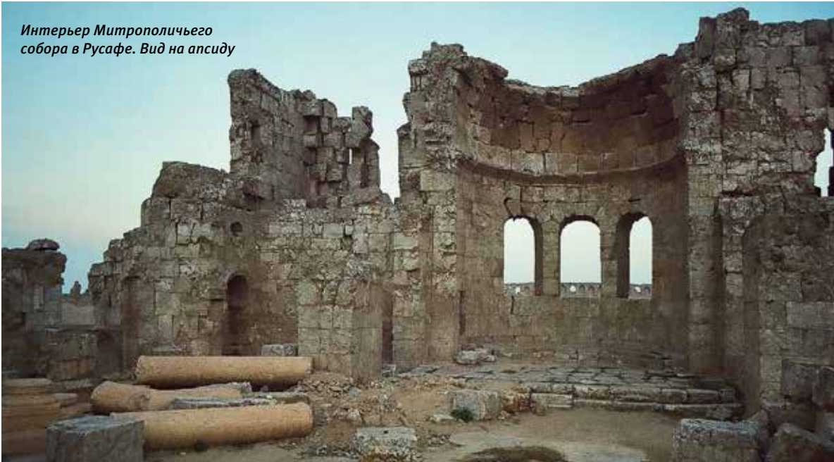
Интерьер Митрополичьего собора в Русафе. Вид на апсиду