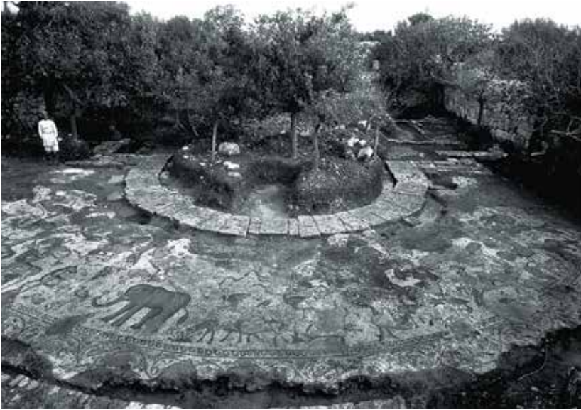
Напольные мозаики собора Св. Феклы Иконийской в Селевкии-Пиерии. Кон. V в. Фото 1938 г.

После разрушения персидским войском в 540 году и захвата арабами в 637 году Антиохия стала уменьшаться, христиане бежали в другие города. Новый расцвет она пережила во время византийского управления 969–1084 годов, а также с 1098 года, став центром Антиохийского княжества