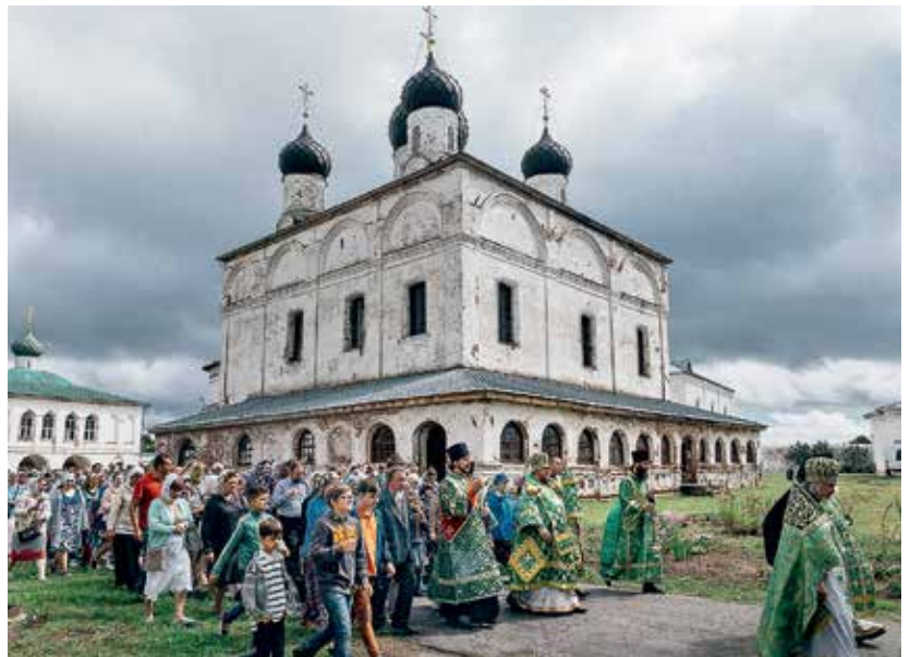
Воссоздание Богоявленского собора Костромского Кремля близко к завершению

Сейчас на стройплощадке вы можете видеть уже законченные во внешних формах Богоявленский собор и колокольню. Принцип воссоздания