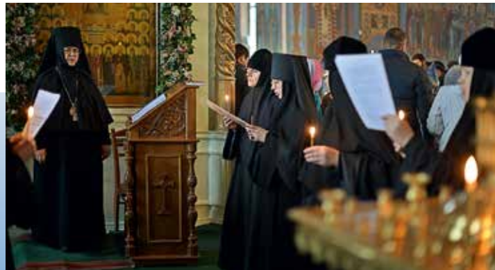
Богоявленский монастырь — место пребывания чудотворной Феодоровской иконы Божией матери