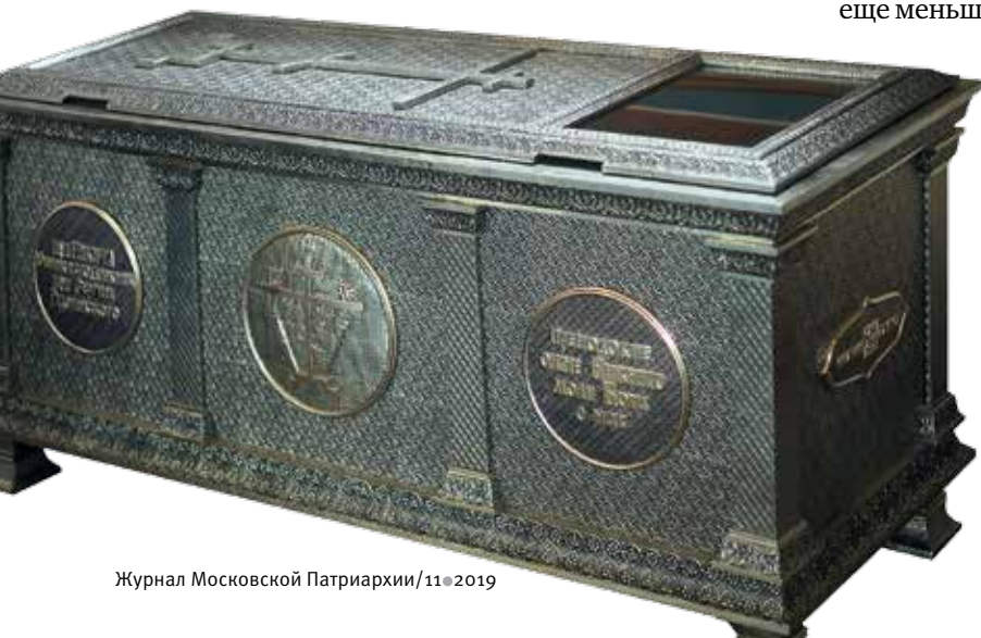
Рака прп. Никиты Костромского

— Сейчас мы разработали перспективный план присутствия Церкви в небольших населенных пунктах Костромской области: где нужны