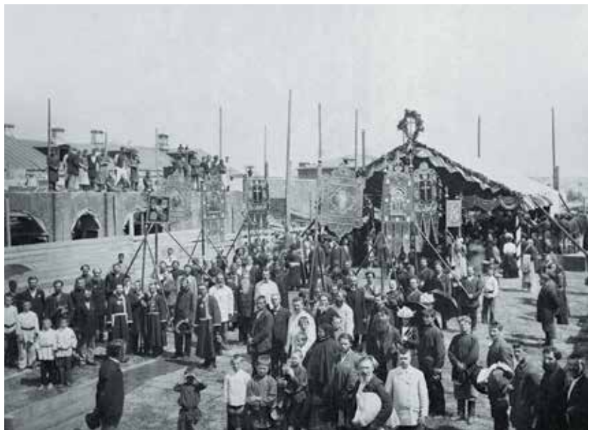
Странноприимница Киево-Печерской лавры (вверху)