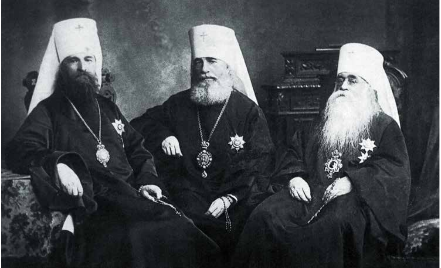
Митрополит Московский Владимир (Богоявленский), митрополит Санкт- Петербургский Антоний (Вадковский) и митрополит Киевский и Галицкий Флавиан (Городецкий)

настаивал на его нелегитимности, что серьезно усиливало конфликт и внутри Церкви, и во взаимоотношениях Церкви с украинской государственной властью.