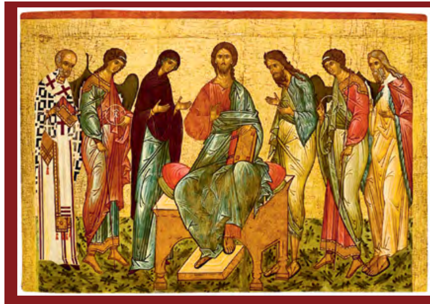
Деисус. Конец XV – начало XVI в. (вверху)