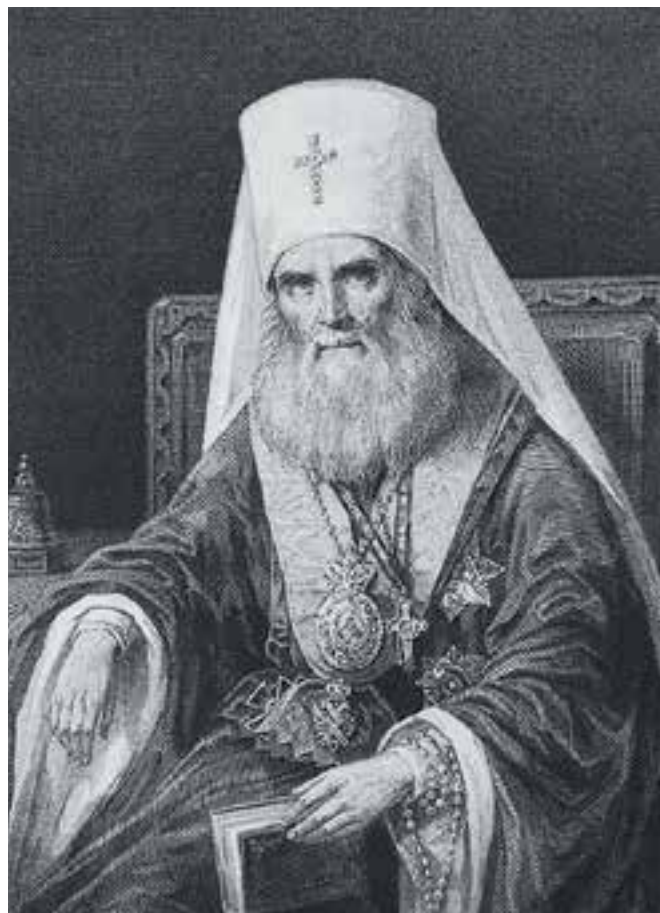
Митрополит Филарет (Дроздов)

Иеромонах Памфил (Осокин) — насельник Свято-Троицкой Сергиевой лавры. В 2012 г. окончил Московскую духовную семинарию, в 2014 г. — магистратуру Московской духовной академии на кафедре церковно-практических дисциплин. В 2013 г. принял монашеский постриг с наречением имени Памфил, в честь преподобного Памфила Спасо-Елиазаровского, и в этом же году рукоположен в сан иеродиакона. В Лавре нес послушания помощника библиотекаря, старшего пономаря соборных храмов Лавры, келейника старцев архимандрита Виталия (Мешкова; 1936–2014) и архимандрита Лаврентия (Постникова; 1933–2020). В 2017–2018 гг. — и. о. настоятеля Сергиевского подворья Лавры в г. Переславле-Залесском. 10 апреля 2018 г. Святейшим Патриархом Московским и всея Руси Кириллом в Успенском соборе Свято-Троицкой Сергиевой лавры рукоположен в сан иеромонаха. В 2021 г. окончил курсы повышения квалификации по направлению «археология», в 2023 г. прошел профессиональную переподготовку по направлению «специалист архива». С 2018 г. несет послушание в Службе делопроизводства и архива Московской Патриархии.