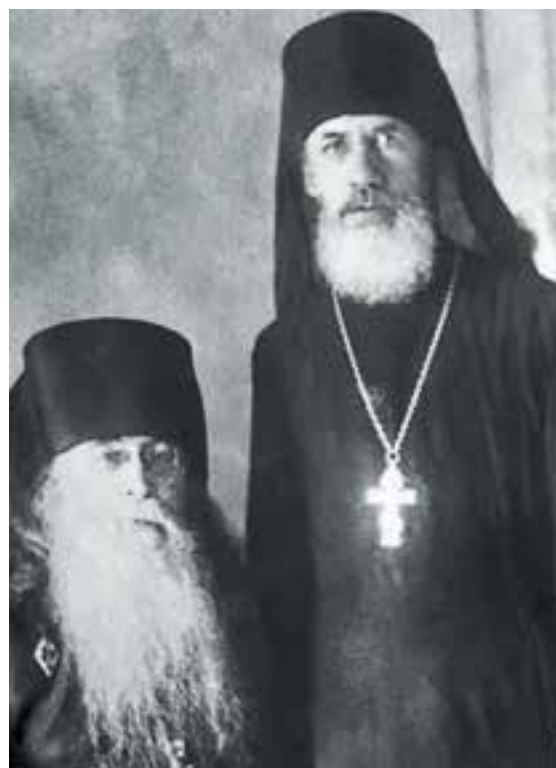
Патриарх Пимен (слева)