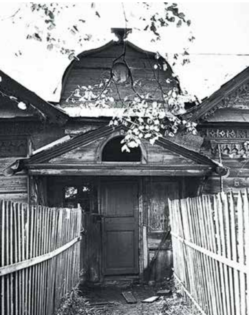
Южная угловая башня (вверху слева) Вид из-за пруда на келью северного комплекса скита (вверху справа) Вход в келью наместника (внизу)

ской волости Пронского уезда Рязанской губернии 2 . В списке населенных пунктов 1859 года Савин-Корь (Савина) числится как казенная деревня, то есть крестьяне имели статус государственных. Расположена «при колодце», «по левую сторону Пронского тракта, из г. Пронска в г. Рязань». В то время там насчитывалось 20 дворов, где проживало 85 мужчин и 80 женщин. Центр уезда располагался в 30 километрах 3 .