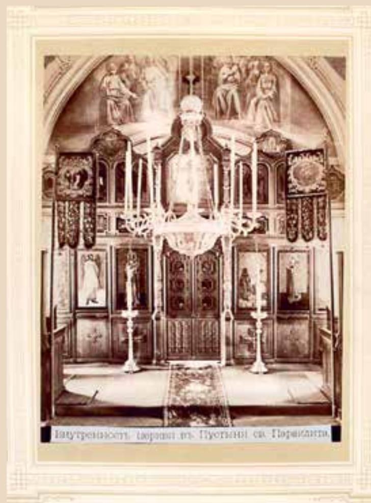
Внутренность, церковь в Пустыни св. Параклита