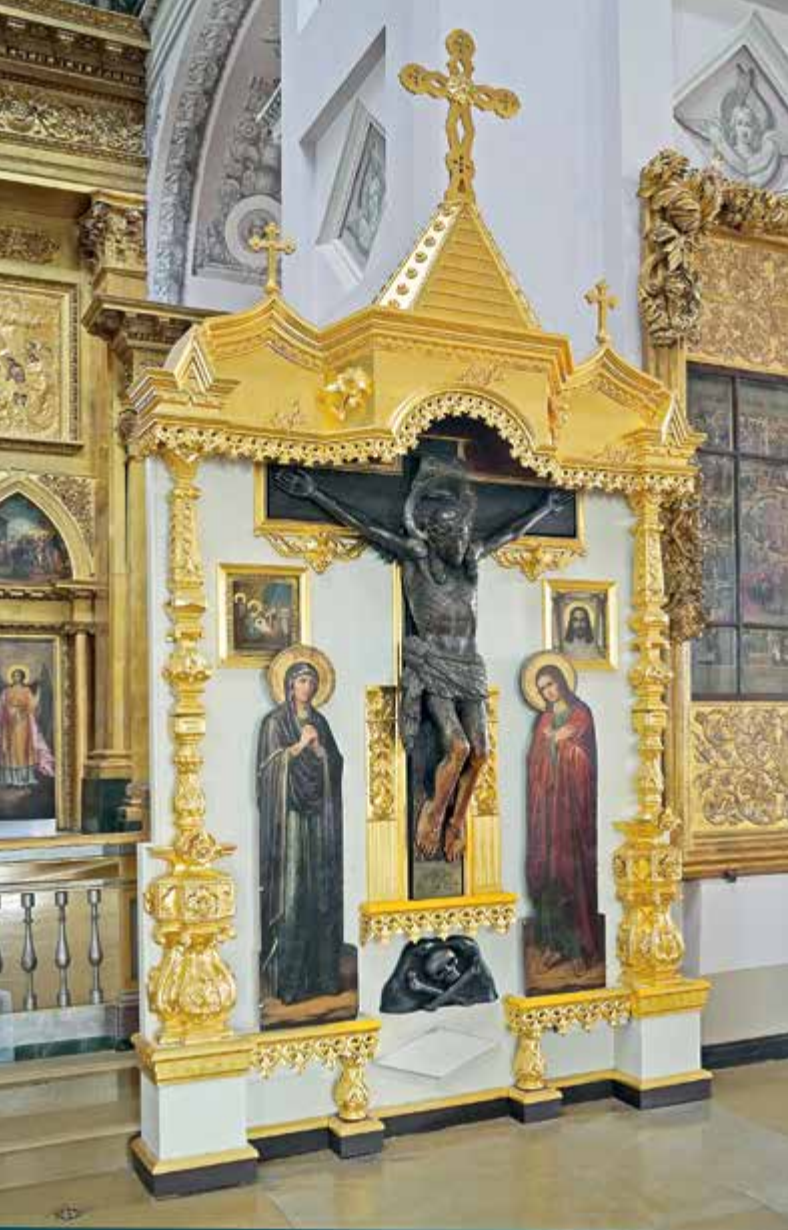
Главная святыня Воскресенского собора — Животворящий Крест Господень (слева)